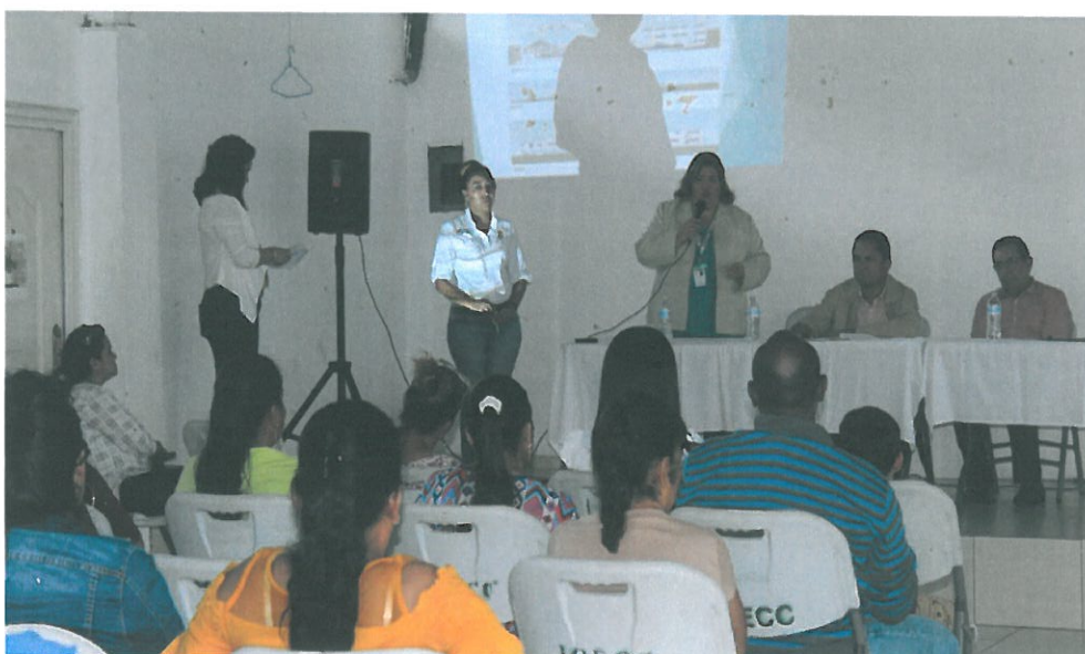
Los residentes que asistieron a la consulta pública mientras firmaban la lista de asistencia