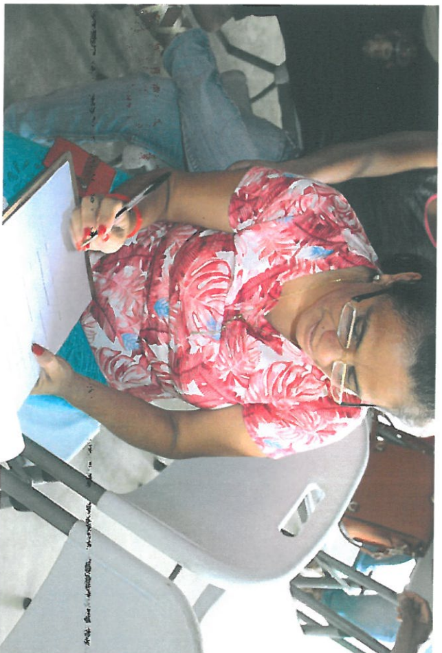
Firma por parte de los residentes del Acta #011 de Cambio de Uso de Suelo C2 para la Finca 434854 del corregimiento de Ernesto Córdoba Campos.