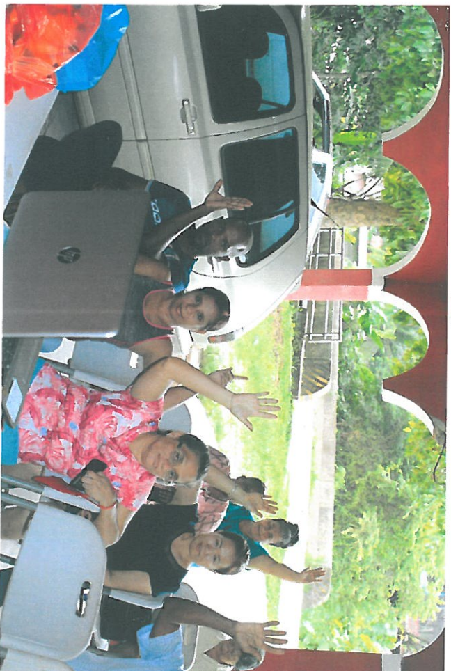
Momentos en que los Residentes de Ernesto Córdoba aprueban el cambio de uso de Suelo.