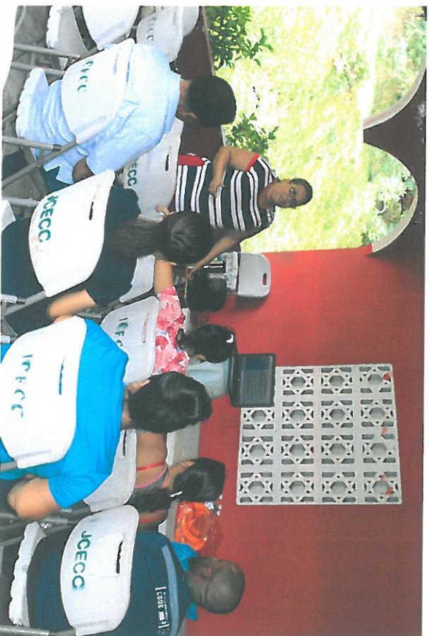
Parte de la comunidad reunida para la Exposición de la Consulta Pública.