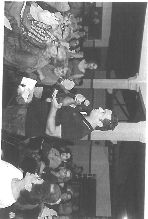
Intervención por parte de los residentes.