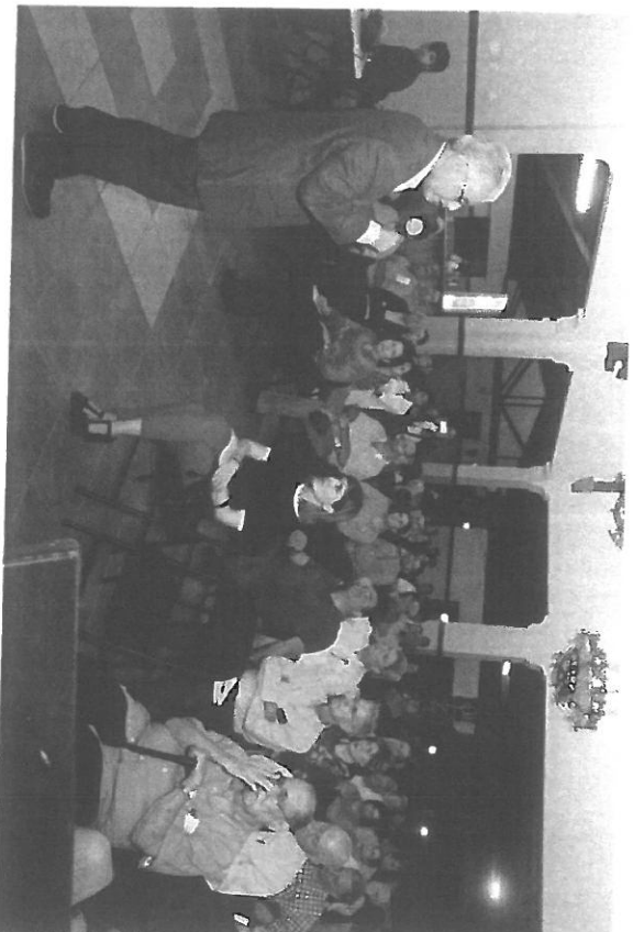
Palabras por el Alcalde del Distrito Capital José Isabel Blandón.