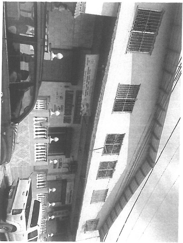
Infraestructura existente en la finca.