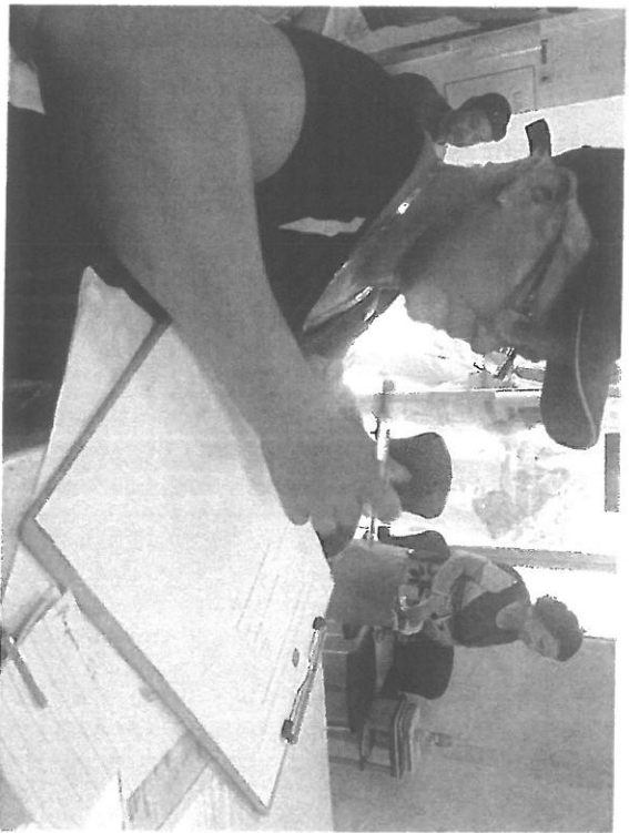
Residentes firman acta de consulta pública.