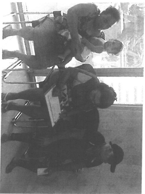
Residentes firman lista de asistencia