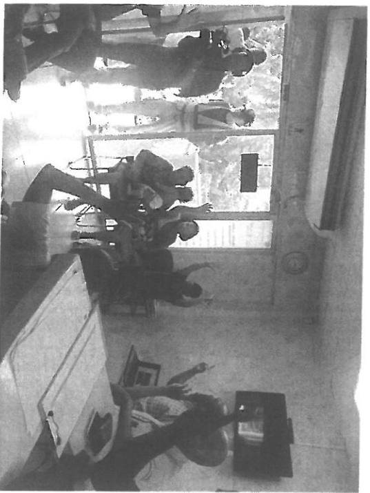
Asistentes ejercen su foto aprobando la adicción de zonificación