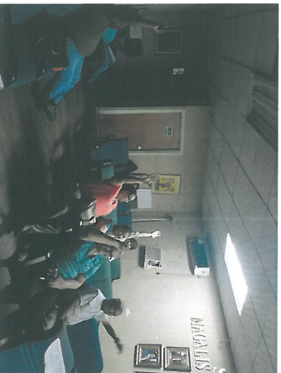
Votación por parte de los residentes.