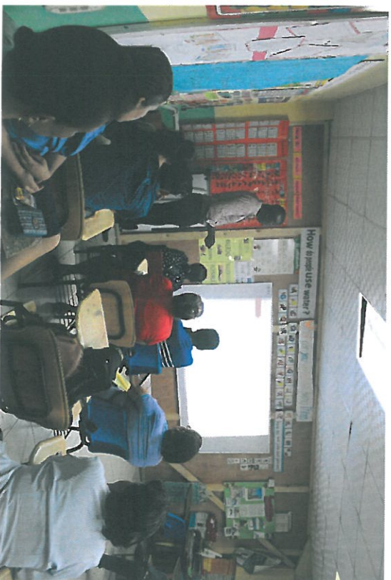
Comunidad escuchando la presentación.