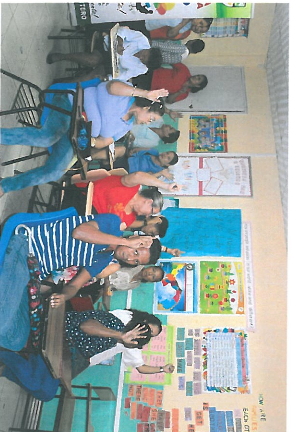
Todos votaron a favor de la asignación de uso de suelo.