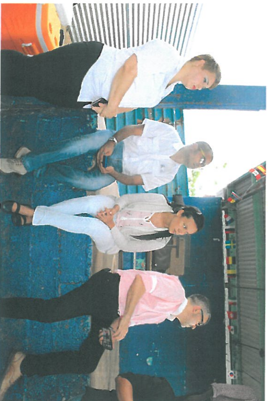
Parte del equipo solicitante del cambio de uso de suelo.