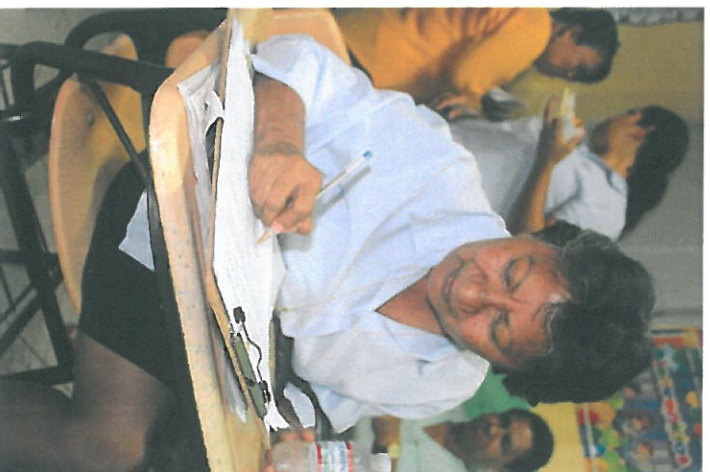
La arquitecta de Planificación Urbana del Municipio de Panamá