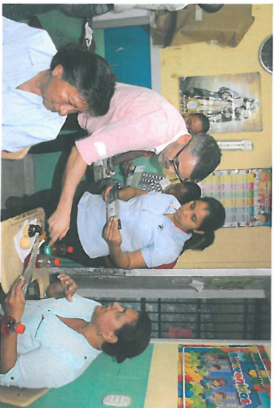
La empresa solicitante del cambio de uso de suelo repartió panfletos dando a conocer el proyecto.