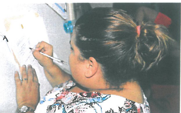
Firma del acta por parte de los residentes.