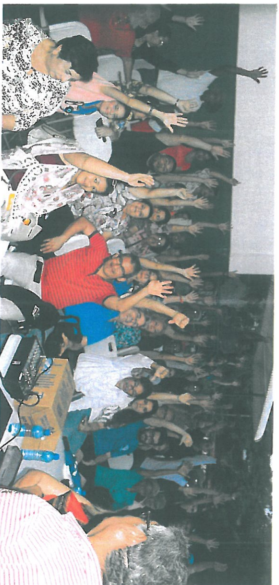
Solo una persona voto a favor del proyecto. Todas las demás, negaron el cambio del uso de suelo.