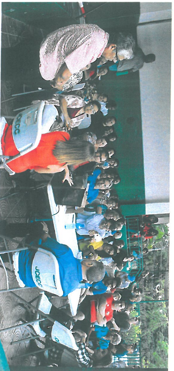
Residentes escuchando la intervención de la proponente.