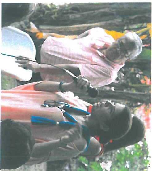
Intervenciones de la Comunidad