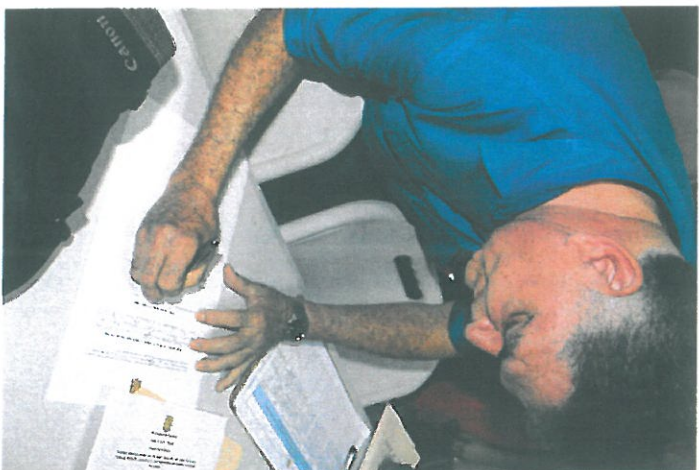
Firma del Representante suplente.