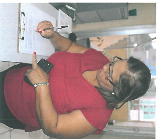
Firma del Acta por parte de los residentes de Curundú.