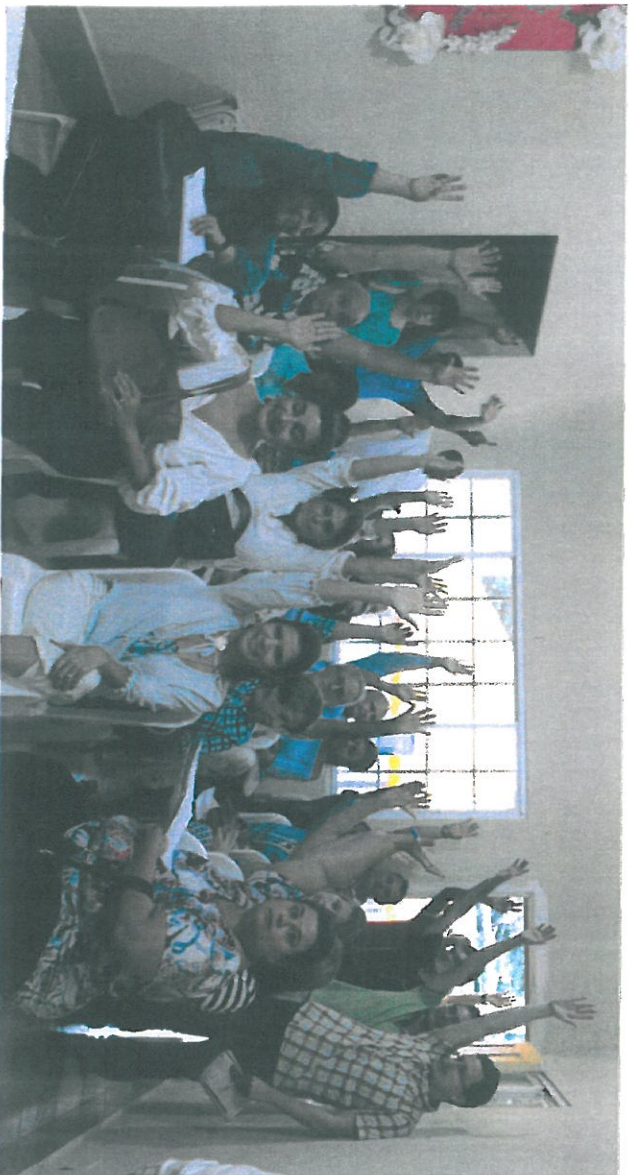
Votación en contra de la asignación de uso de suelo Público.