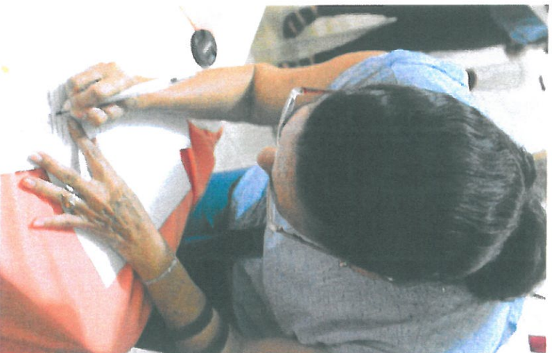
Firma de las Actas por parte de los residentes