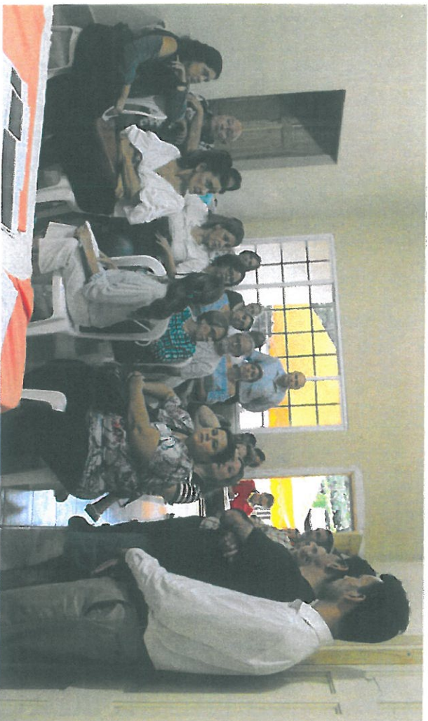
Residentes que asistieron a la consulta pública.