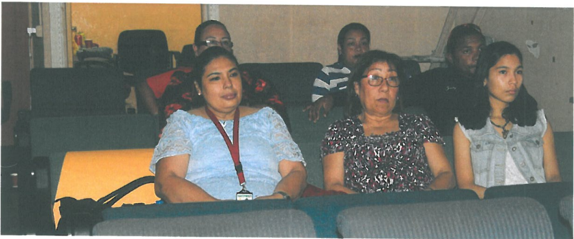
Personal del Municipio y residentes escuchando la consulta pública