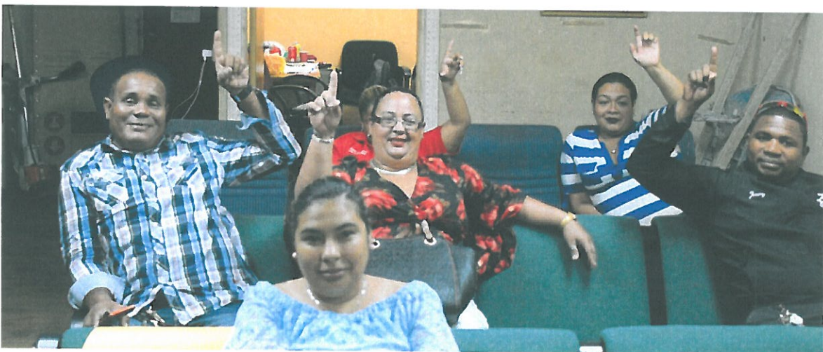
Todos los presentes votaron a favor de la adición de cambio de suelo.