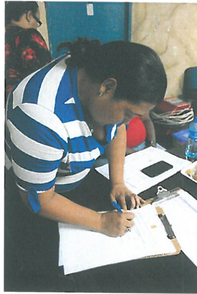
Firma por parte de las residentes