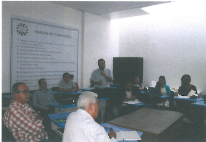
Residentes escuchan propuesta de la asignación.