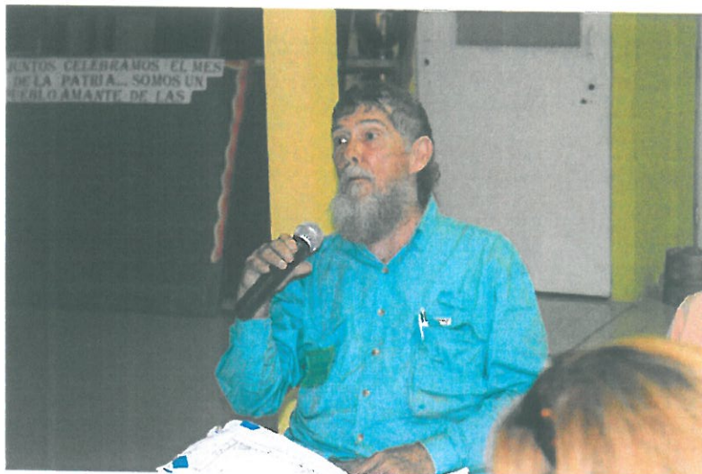
Participación de uno de los residentes de las comunidades impactadas.