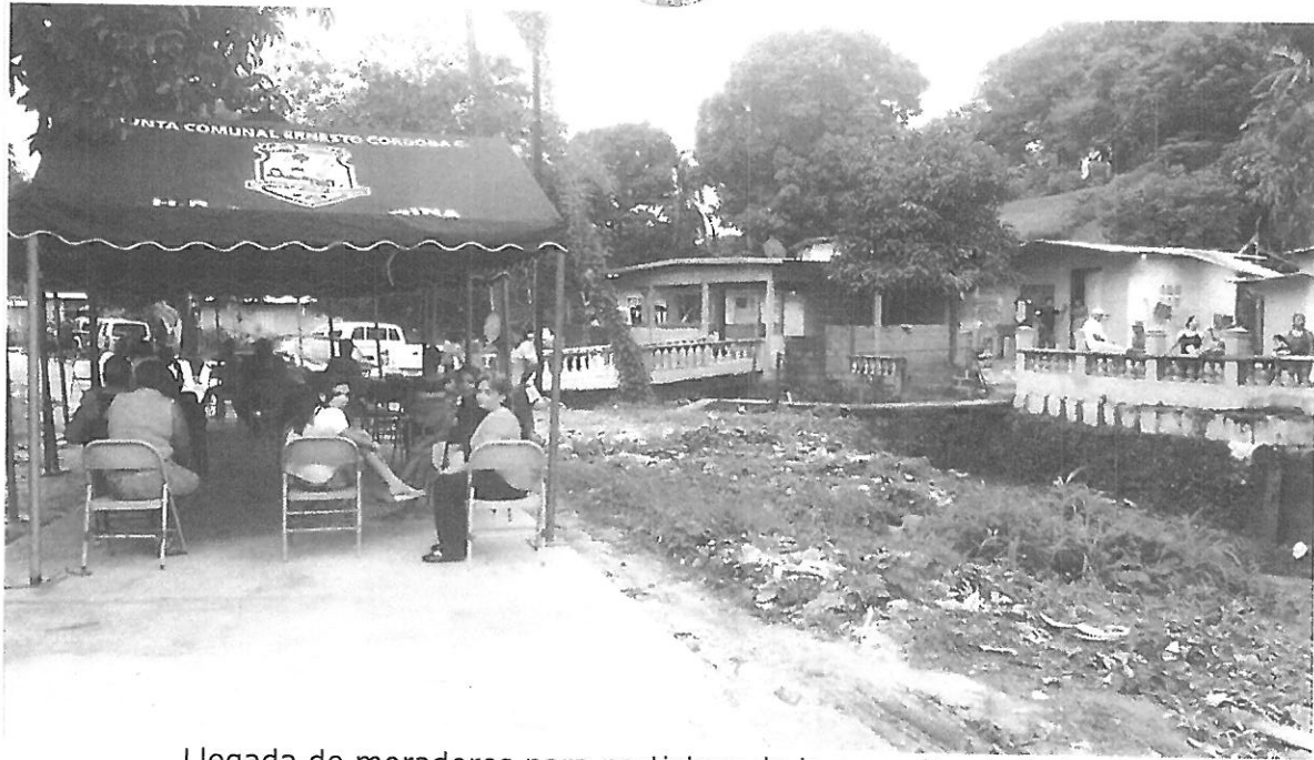
Llegada de moradores para participar de la consulta ciudadana.