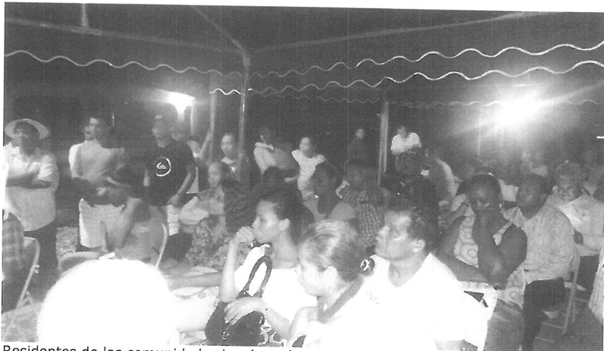
Residentes de las comunidades involucradas escuchan la presentación de los proyectos por parte de la Junta Comunal.