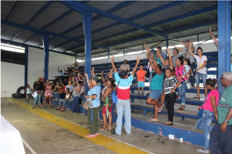
Diferentes sectores unidos, aprobando los proyectos para sus comunidades.