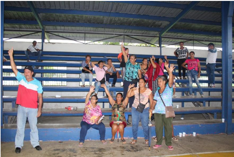
Aprobación de los proyectos por parte de la comunidad.