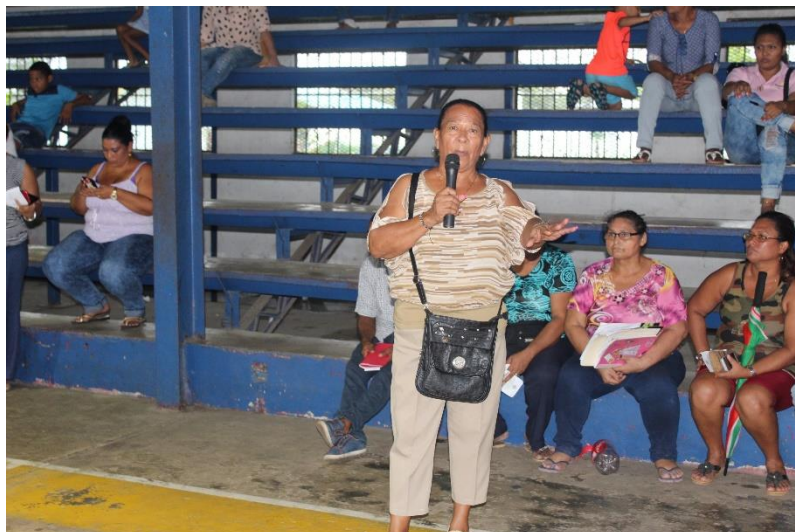
Residente expone las necesidades de su barriada.