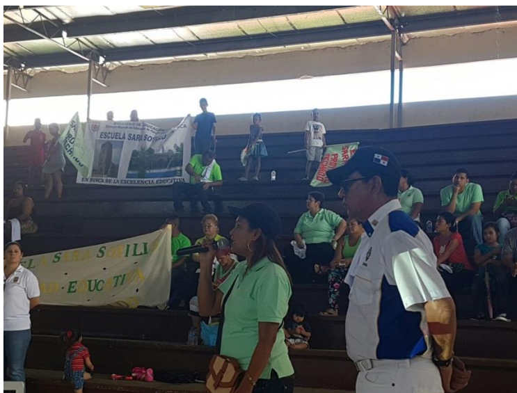
Intervenciones de los ciudadanos.