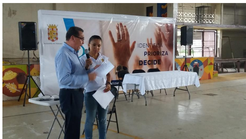
Intervención de los moradores.