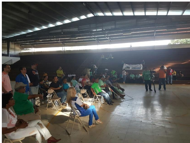
Durante la espera previa al conteo.