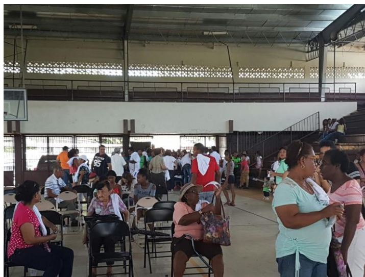
Al fondo: Continuaban llegando residentes al Gimnasio.