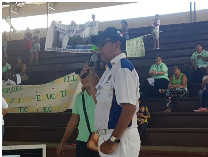
Intervenciones de la comunidad.