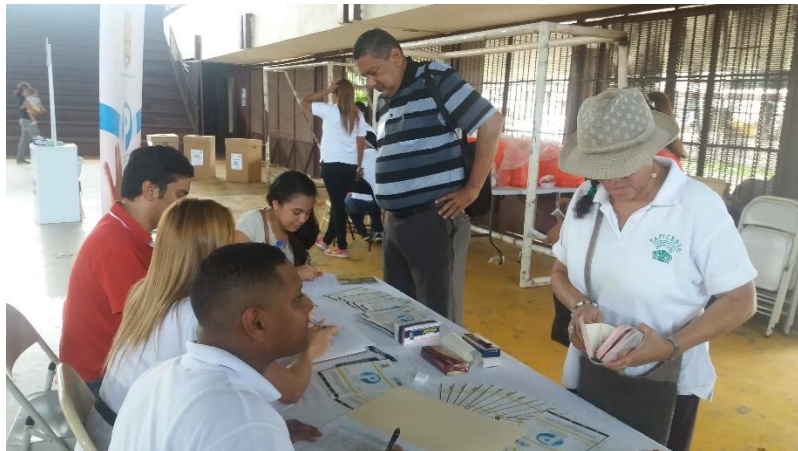
Inscripción de residentes.