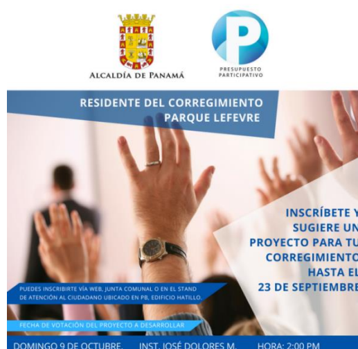
Volante para redes sociales