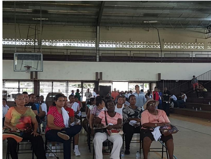
Residentes a la espera de resultados.