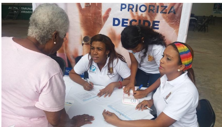
Llegada de los residentes.