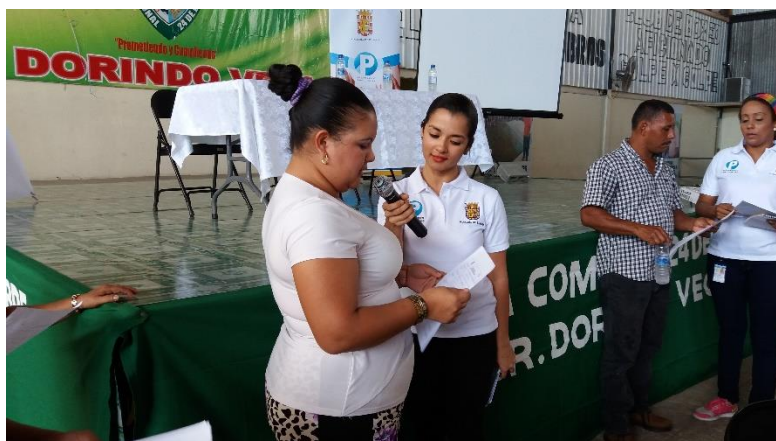
Presentación de propuestas.