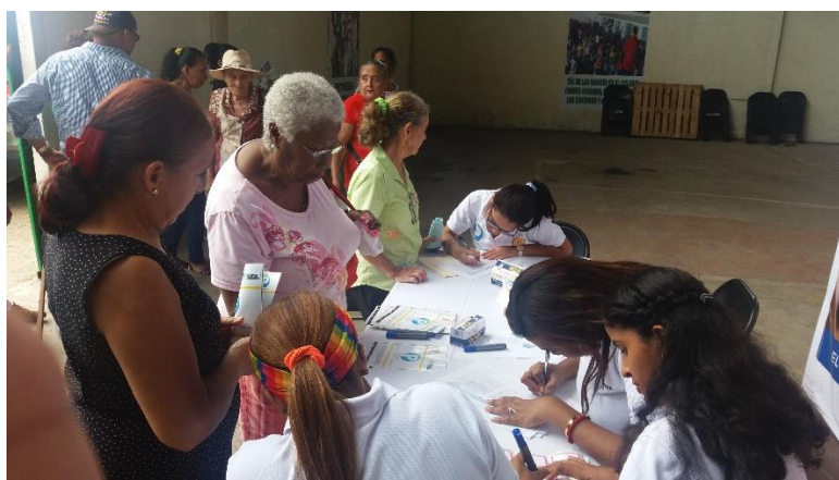
Proceso de inscripción.