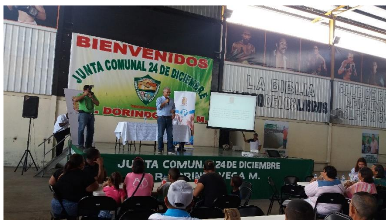
Intervención del Alcalde del distrito de Panamá, José Blandón Figueroa.