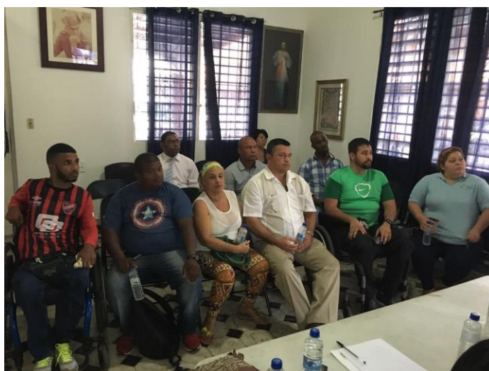
Representantes de mesa elegidos en el primer taller.