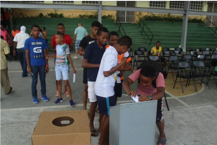
Residentes votan por sus proyectos.