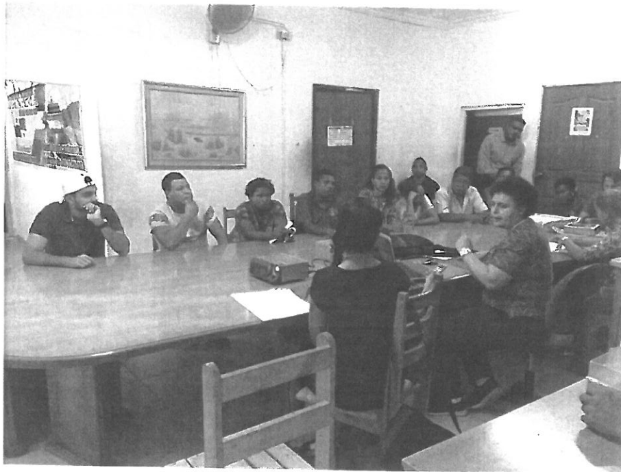
La Consulta Pública se desarrollo en la Junta Comunal de Pacora