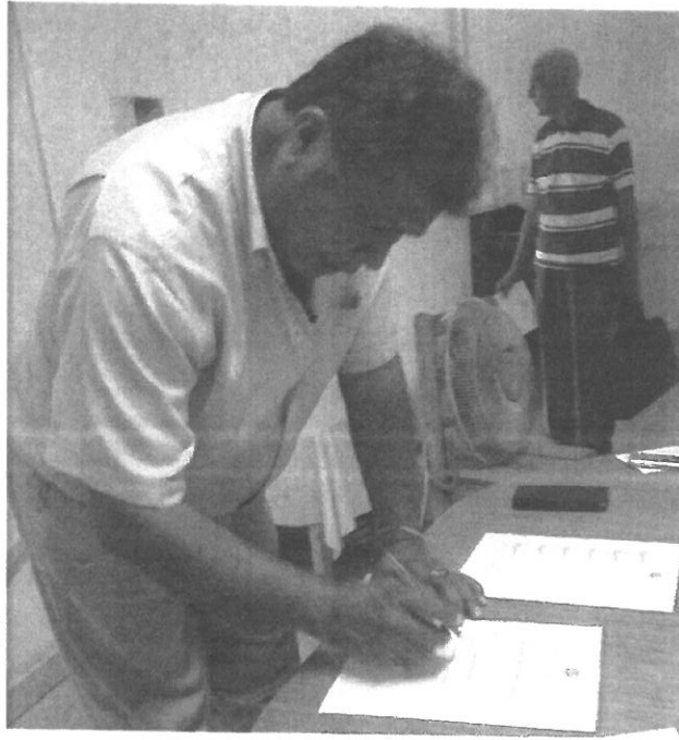
Firma por parte de la Junta Comunal de Pacora