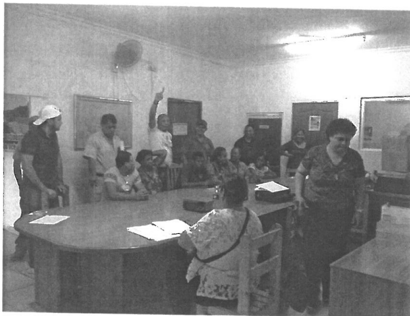
Personas en contra del proyecto