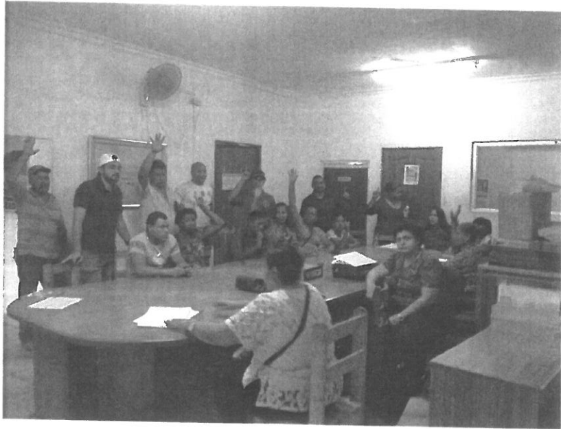
Personas a favor del proyecto