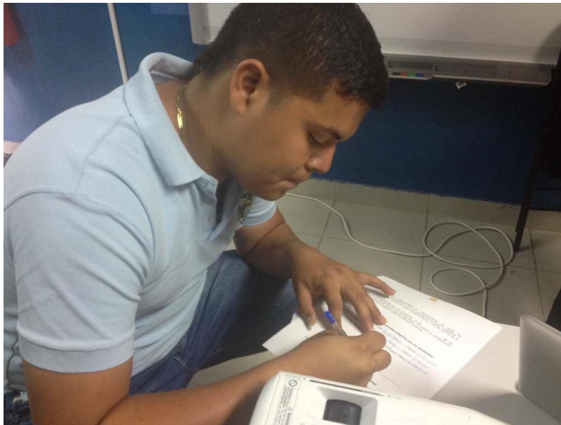
Firma por parte de la Junta Comunal de San Francisco.