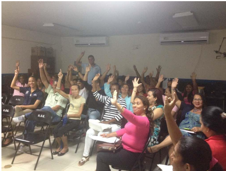
Todos los presentes estuvieron de acuerdo con el Punto de Cultura en Las Cumbres