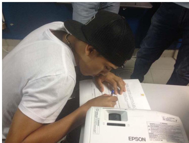
Residente del área firma acta.