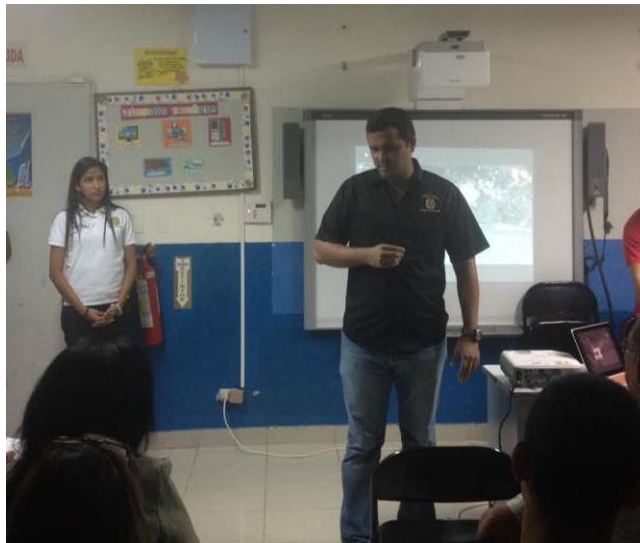
Presentación del Proyecto por Parte de la Dirección de Cultura