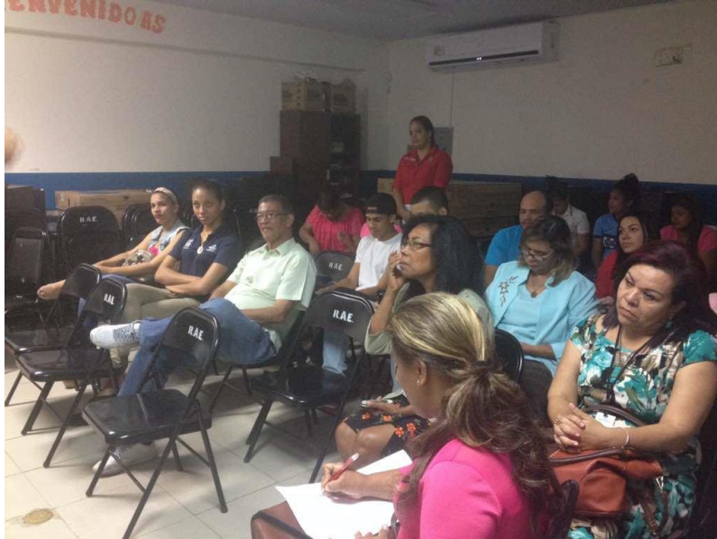
Ciudadanos de las Cumbres y Personal de Escuela Árabe de Egipto