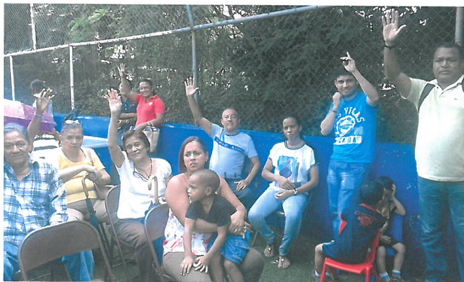
Votación por parte de los residentes de Pueblo Nuevo a favor de la remodelación de la Cancha de Sintética Negrito Quiñones