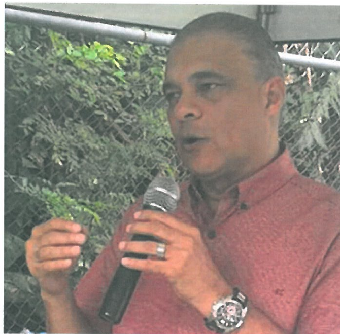
Palabras de Bienvenida por parte de del Honorable Representante Lee del Corregimiento de Pueblo Nuevo.