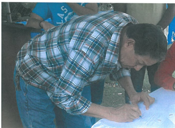
Firmas por parte de los residentes de Pueblo Nuevo