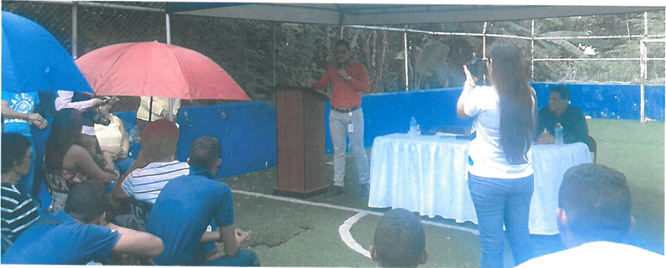
Presentación por parte del Municipio de Panamá