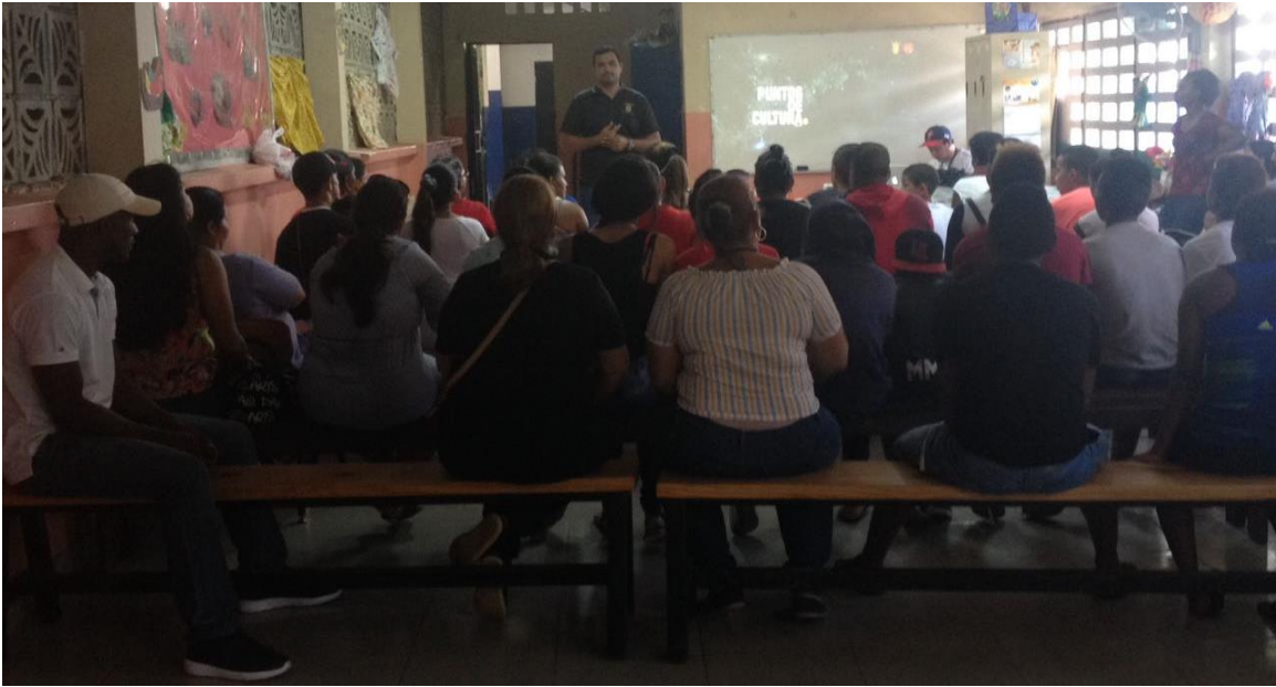
Departamento de Cultura explicando el proyecto.

Firma del Acta por tres miembros de la comunidad: