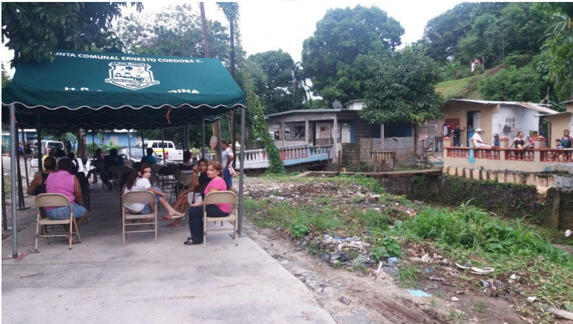
Llegada de moradores para participar de la consulta ciudadana.