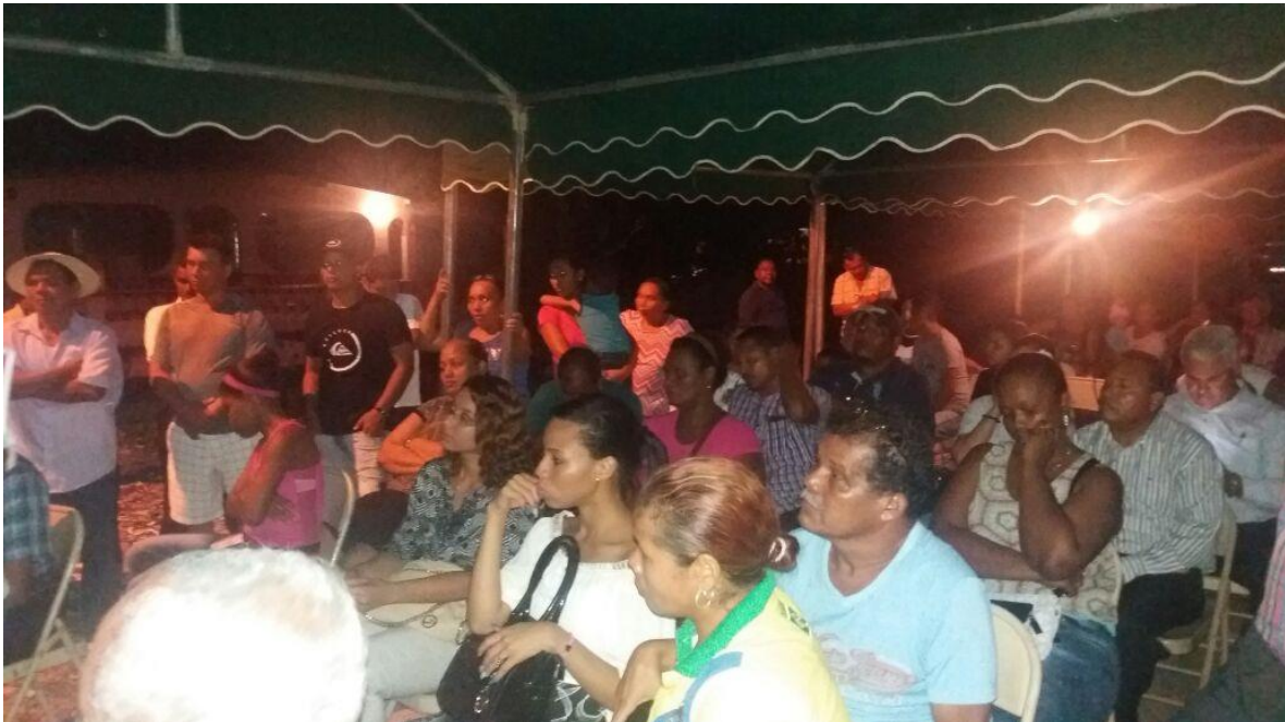
Residentes de las comunidades involucradas escuchan la presentación de los proyectos por parte de la Junta Comunal.