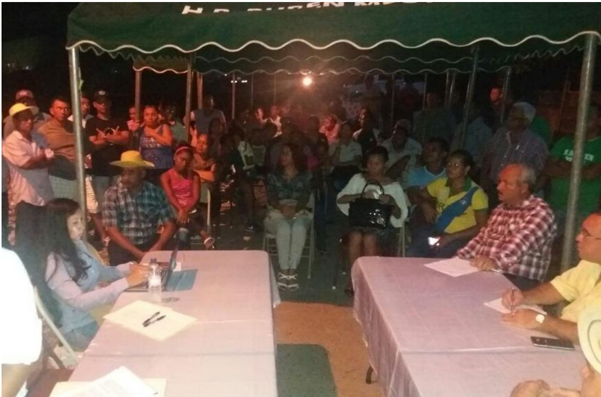
Moradores y autoridades presentes en la consulta.