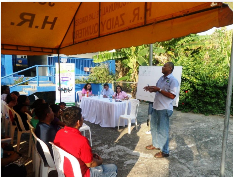
Presentación del proyecto a la comunidad