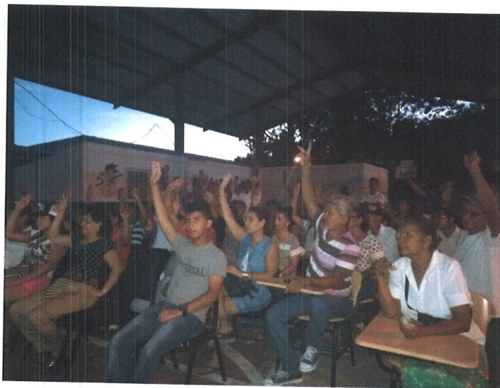
Aprobación de los proyectos por parte de los residentes.