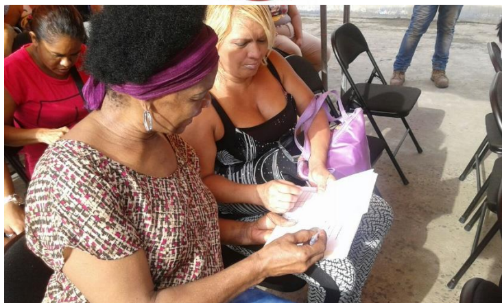
Miembros de la comunidad escriben sus comentarios.