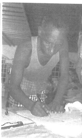
Firma del Acta de la Consulta Ciudadana por parte de los moradores de la comunidad.